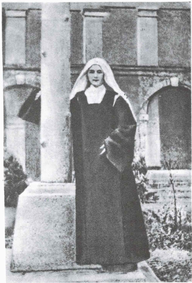
SANTA TERESITA EN EL PATIO DEL CARMEN, JUNTO AL CRUCIFIJO