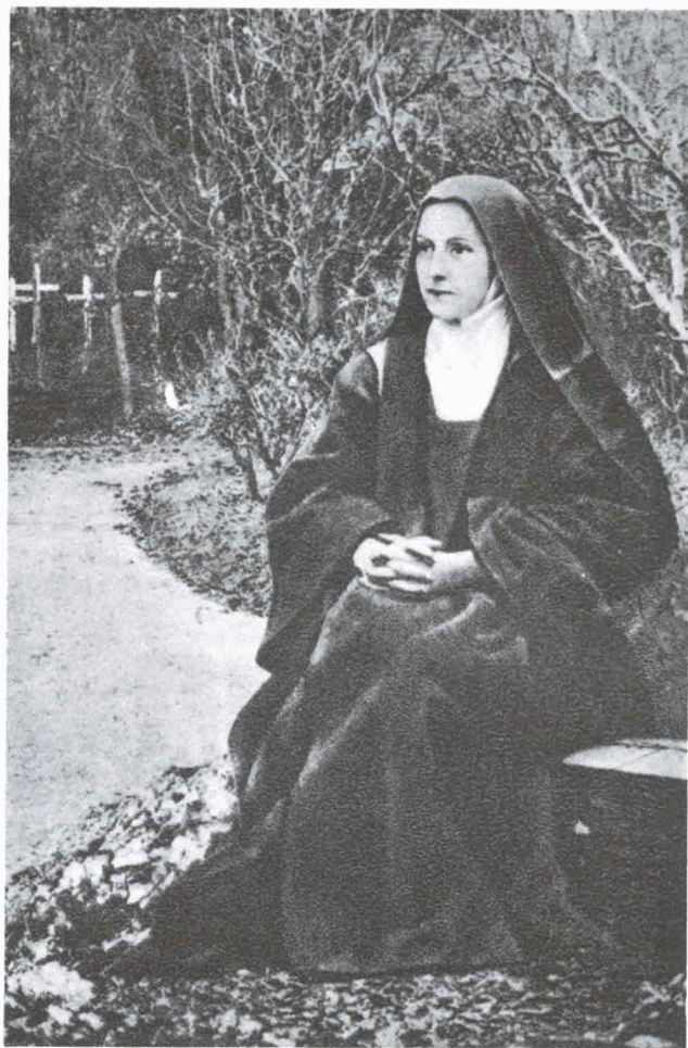
SANTA TERESITA EN EL JARDIN DEL CARMEN Epoca de su enfermedad.