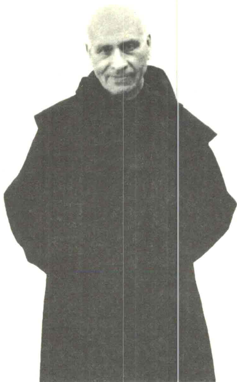
Retrato del autor en su ancianidad